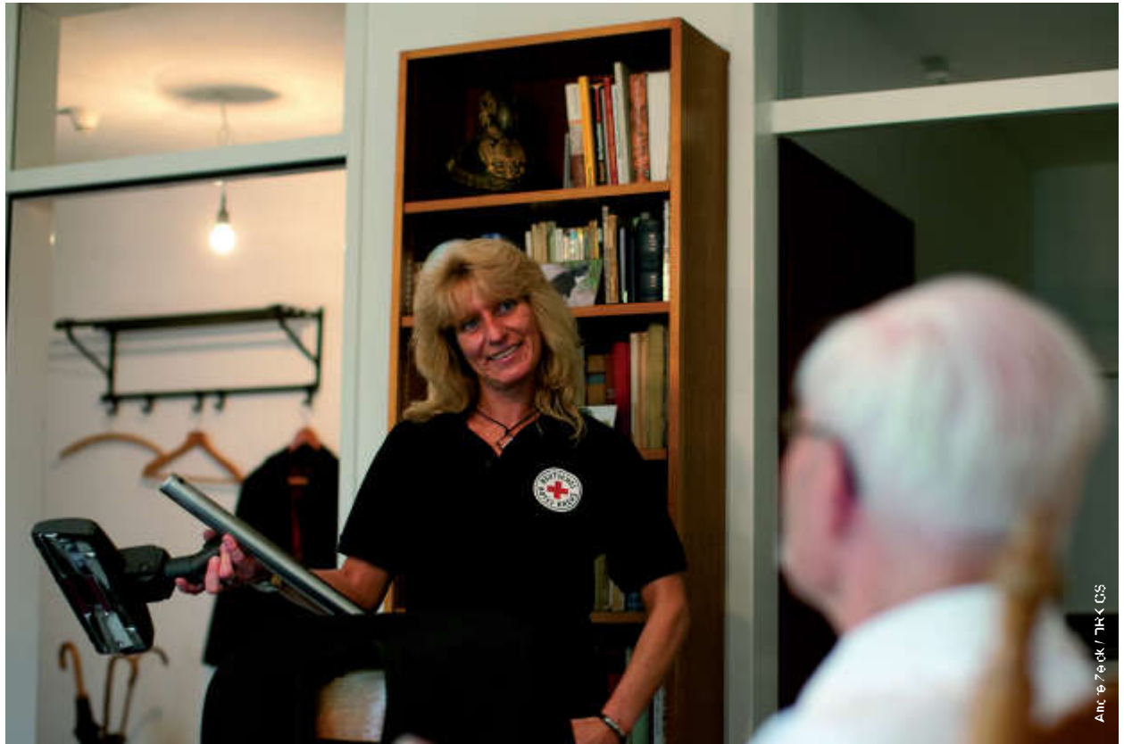
Anne Feick / DRK CS