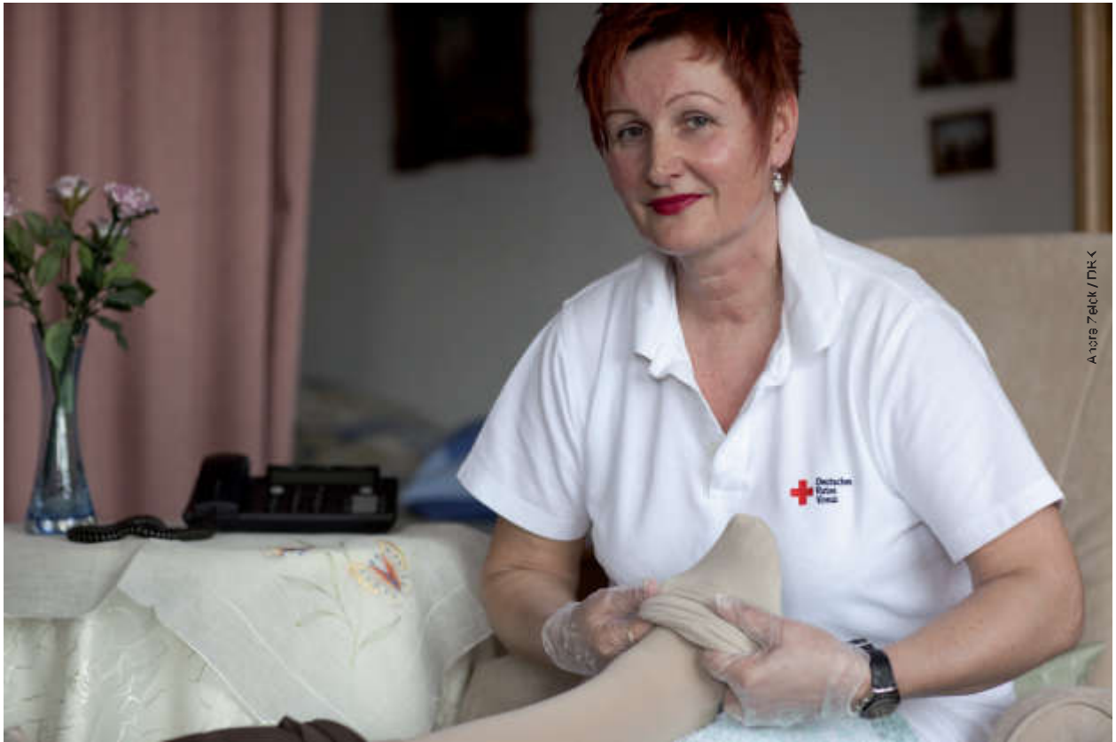
Anne Feick / DRK