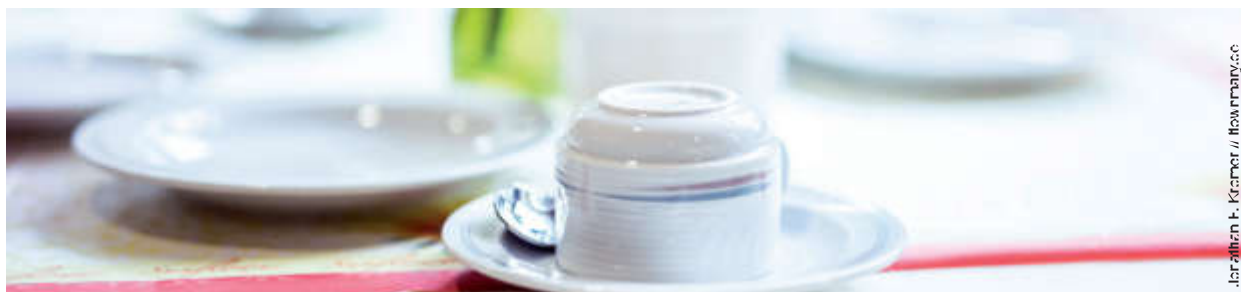
Illustration: F. Kramer / fotostory.de